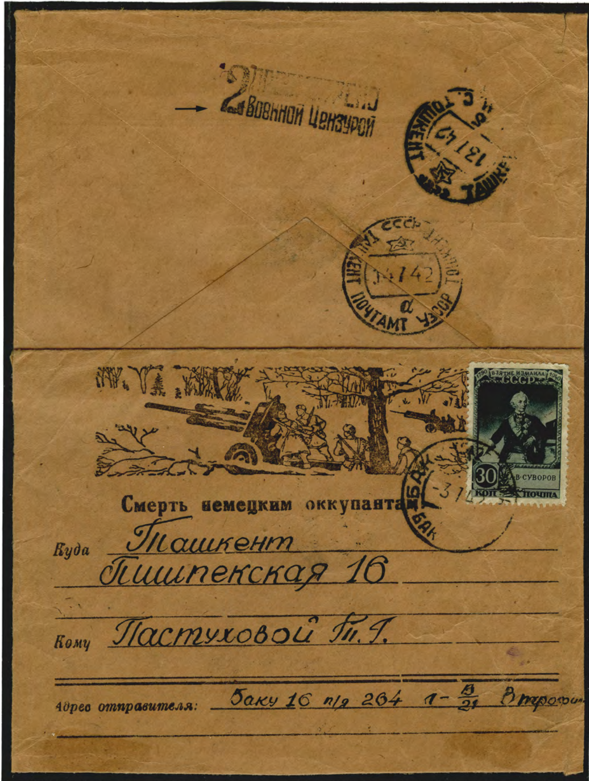
Иногороднее письмо, отправленное из Баку 03.07.1942 в г. Ташкент. Получено 13.07.1942.