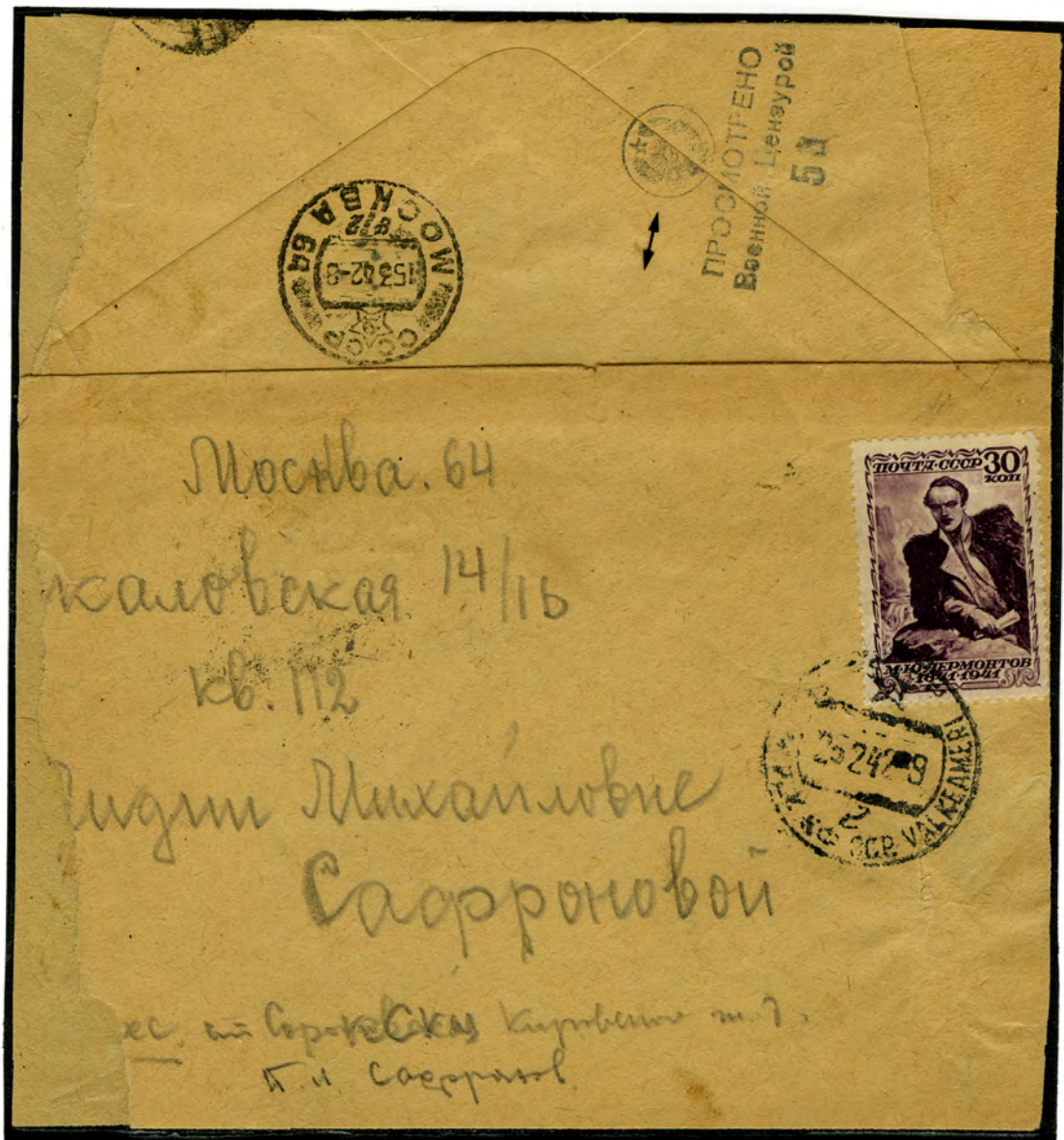
Иногороднее письмо, отправленное из г. Валкеамери, К-Ф ССР 26.02.1942 в Москву. Получено 15.03.1942. (Просмотрено военной цензурой № 50).