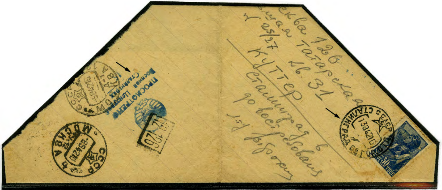
Иногороднее письмо, отправленное из г. Сталинграда 13.08.1942 в Москву. Получено 09.09.1942. (Просмотрено военной цензурой Сталинград №15)

3.6. ГЕРБ СССР, ТЕКСТ «ПРОСМОТРЕНО ВОЕННОЙ ЦЕНЗУРОЙ» В ДВЕ СТРОКИ, НАЗВАНИЕ ГОРОДА № ЦЕНЗОРА (ИСПОЛЬЗОВАЛИСЬ В БОЛЬШЕНСТВЕ ОБЛАСТНЫХ И КРАЕВЫХ ГОРОДОВ, СТОЛИЦАХ СОЮЗНЫХ РЕСПУБЛИК)