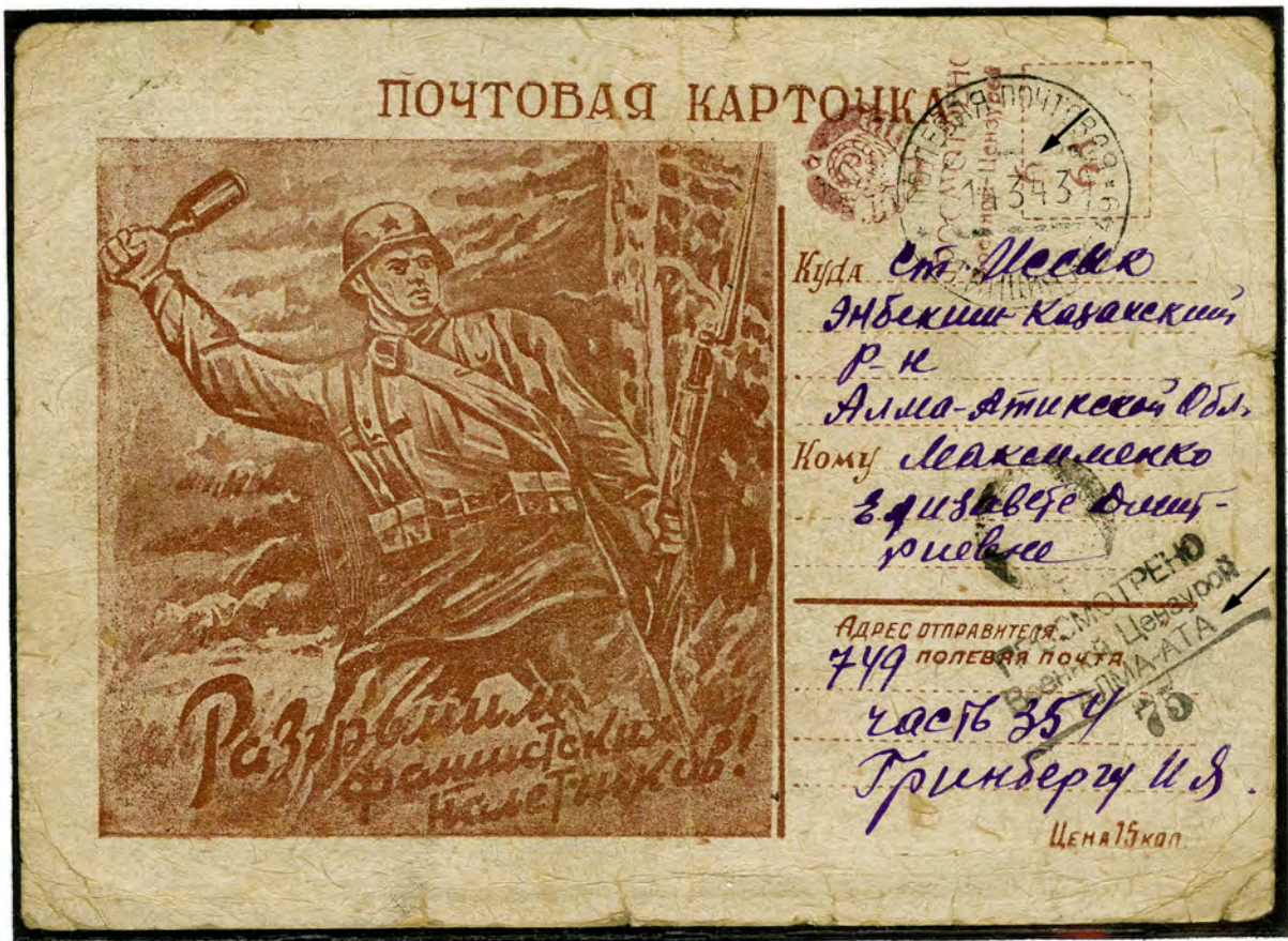
Почтовая карточка, отправленная из № 749 14.03.1943 на ст. Исскы, Алма-Атинской обл. (Просмотрено военной цензурой Алма-Ата №75)

3.6. ГЕРБ СССР, ТЕКСТ «ПРОСМОТРЕНО ВОЕННОЙ ЦЕНЗУРОЙ» В ДВЕ СТРОКИ, НАЗВАНИЕ ГОРОДА № ЦЕНЗОРА (ИСПОЛЬЗОВАЛИСЬ В БОЛЬШЕНСТВЕ ОБЛАСТНЫХ И КРАЕВЫХ ГОРОДОВ, СТОЛИЦАХ СОЮЗНЫХ РЕСПУБЛИК)