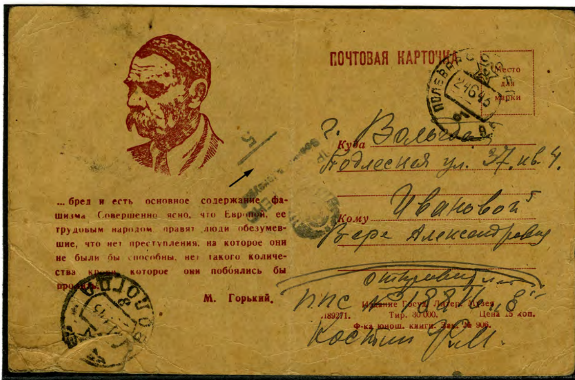
Почтовая карточка, отправленная из "1", 18816 24.06.1943 в г. Вологду. Получена 21.07.1943 (Просмотрено военной цензурой 5)