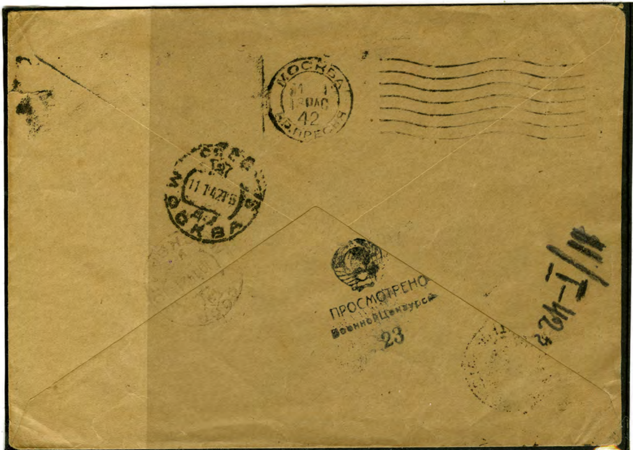
Иногороднее письмо, отправленное со ст. Океанская, Приморского края 23.12.1941 в Москву. Получено 11.01.1942. (Просмотрено военной цензурой №23)