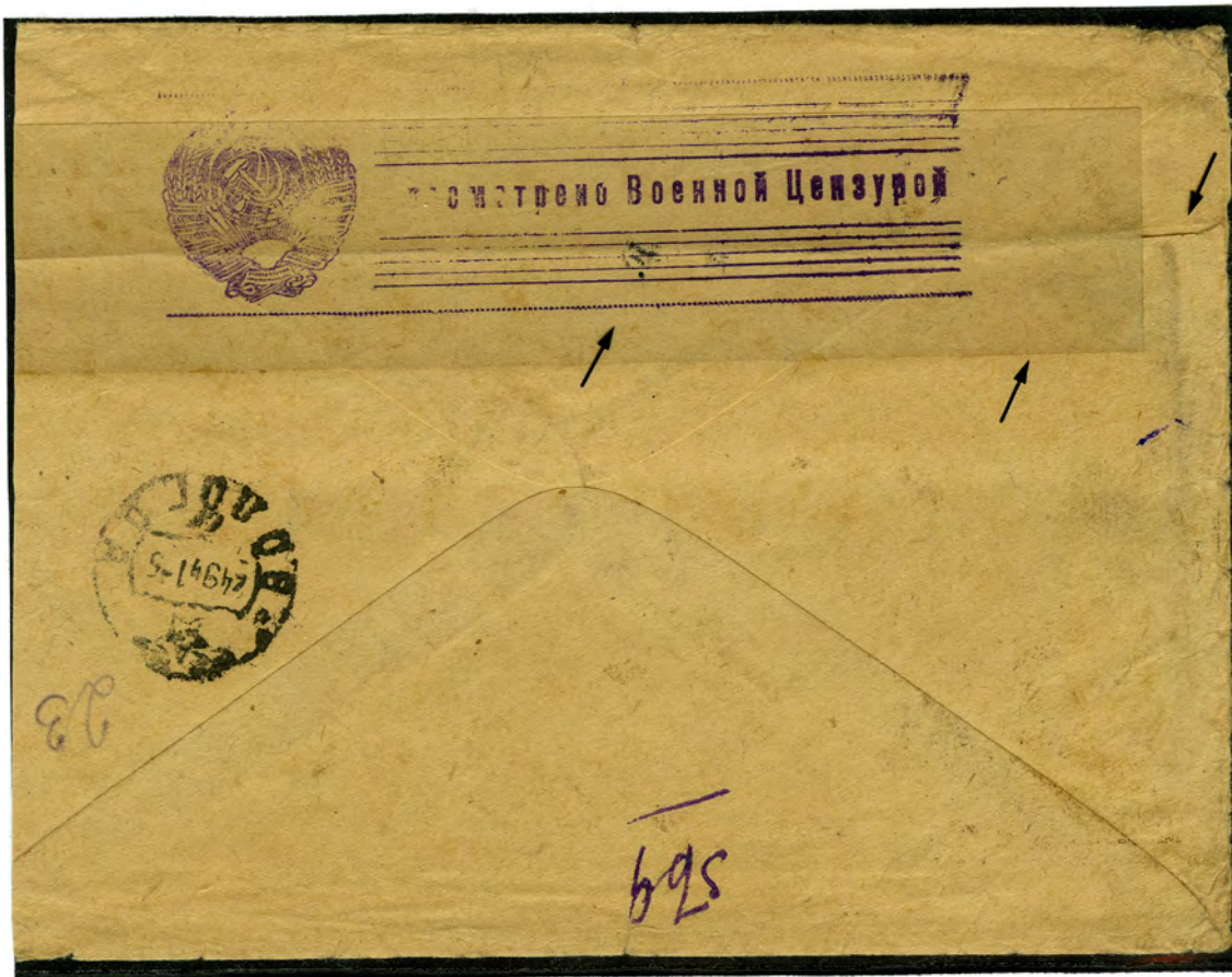
Заказное письмо, отправленное из ППС 145 10.09.1941 в Вологду. Получено 24.09.1941.