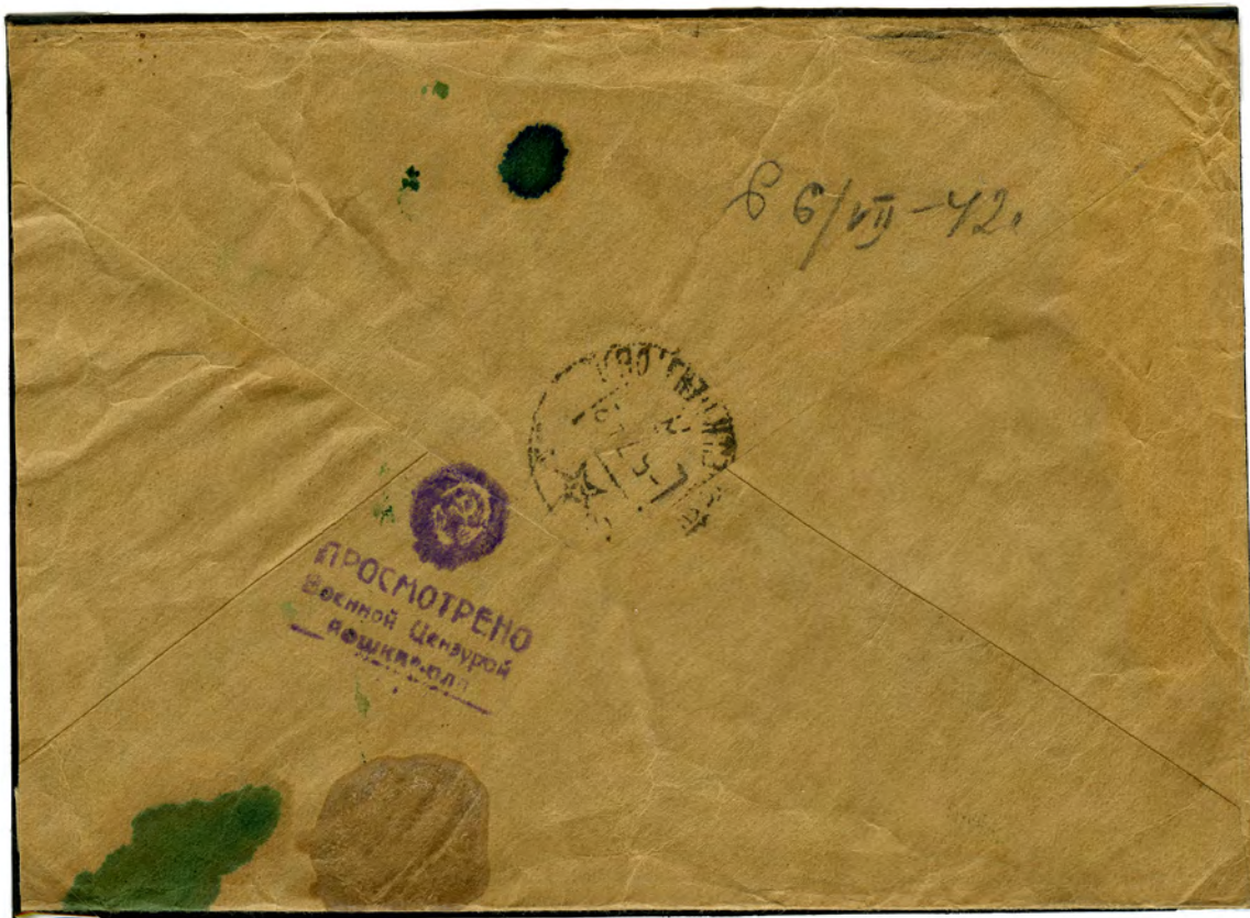
Иногороднее письмо, отправленное со ст. Сурок, Марийской АССР 22.06.1942 в г. Кузнецк, Пензенской обл. Получено 06.07.1942. ( Просмотрено военной цензурой Йошкар-Ола )

ГЕРБ СССР, ТЕКСТ «ПРОСМОТРЕНО ВОЕННОЙ ЦЕНЗУРОЙ» В ДВЕ СТРОКИ, НАЗВАНИЕ ГОРОДА № ЦЕНЗОРА (ИСПОЛЬЗОВАЛИСЬ В БОЛЬШЕНСТВЕ ОБЛАСТНЫХ И КРАЕВЫХ ГОРОДОВ, СТОЛИЦАХ СОЮЗНЫХ РЕСПУБЛИК)