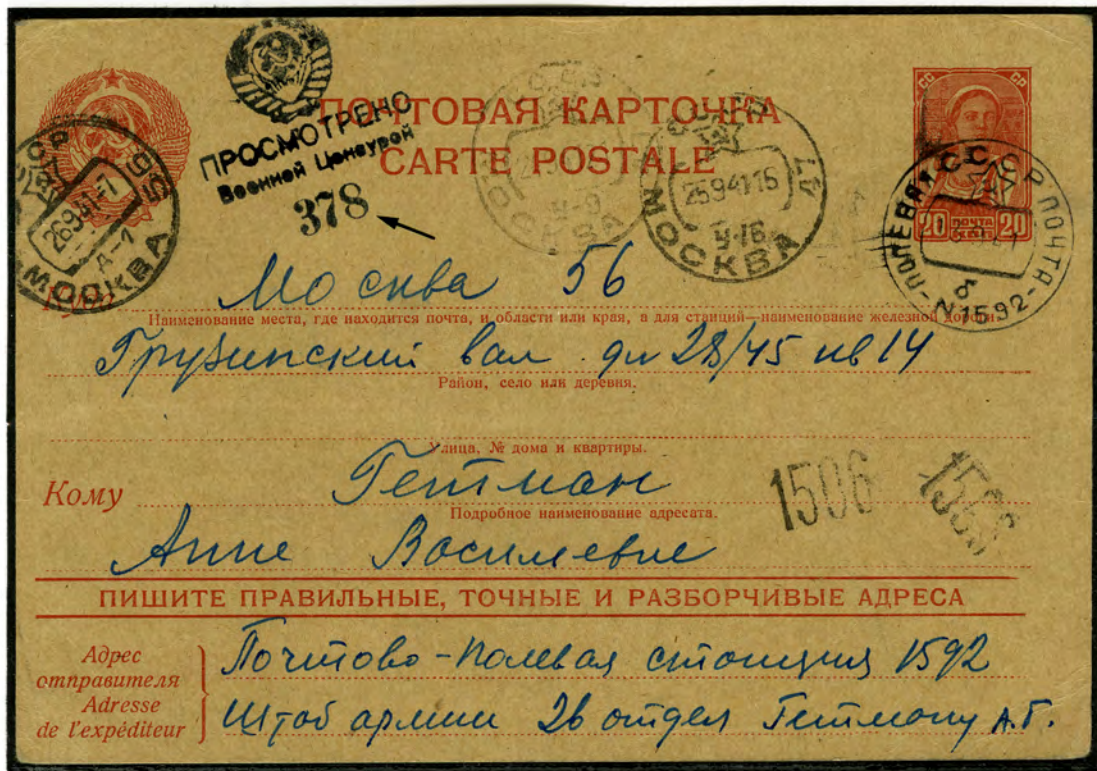
Почтовая карточка отправлена из "1", № 1592 13.09.1941 в Москву. Получена 26.09.1941. (Просмотрено военной цензурой №378)

ГЕРБ СССР, ТЕКСТ «ПРОСМОТРЕНО ВОЕННОЙ ЦЕНЗУРОЙ» В ДВЕ СТРОКИ, № ЦЕНЗОРА (ВВЕДЕНА С НАЧАЛА АВГУСТА 1941 г.)