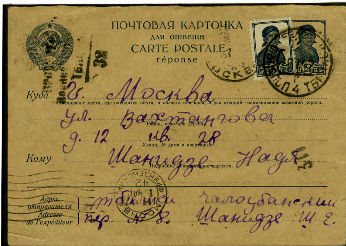
Иногородняя почтовая карточка, отправленная из Тбилиси 06.07.1942 в Москву. Получена 17.07.1942. (Просмотрено военной цензурой Тбилиси №32)