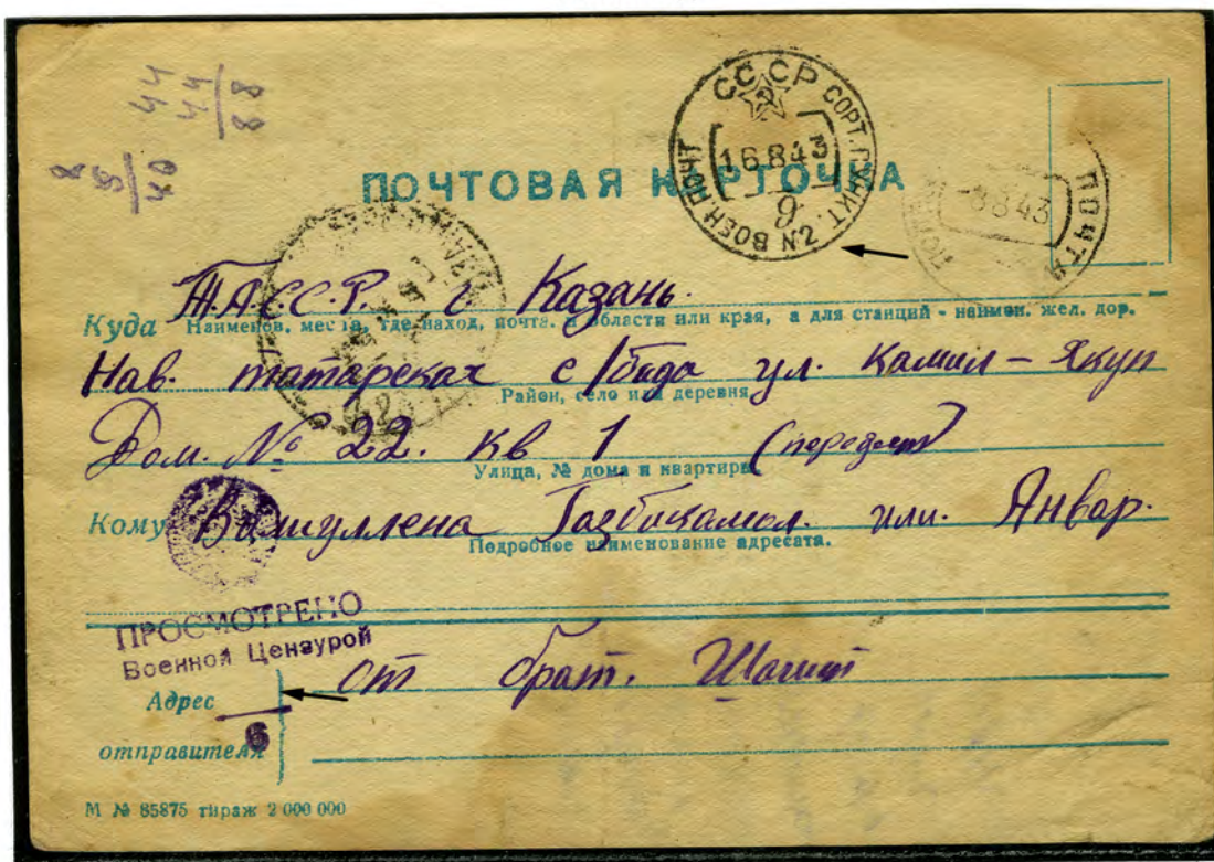
Почтовая карточка, отправленная из "1", 08.08.1943 через ВПС №2 (16.08.1943) в г. Казань. (Просмотрено военной цензурой 6)