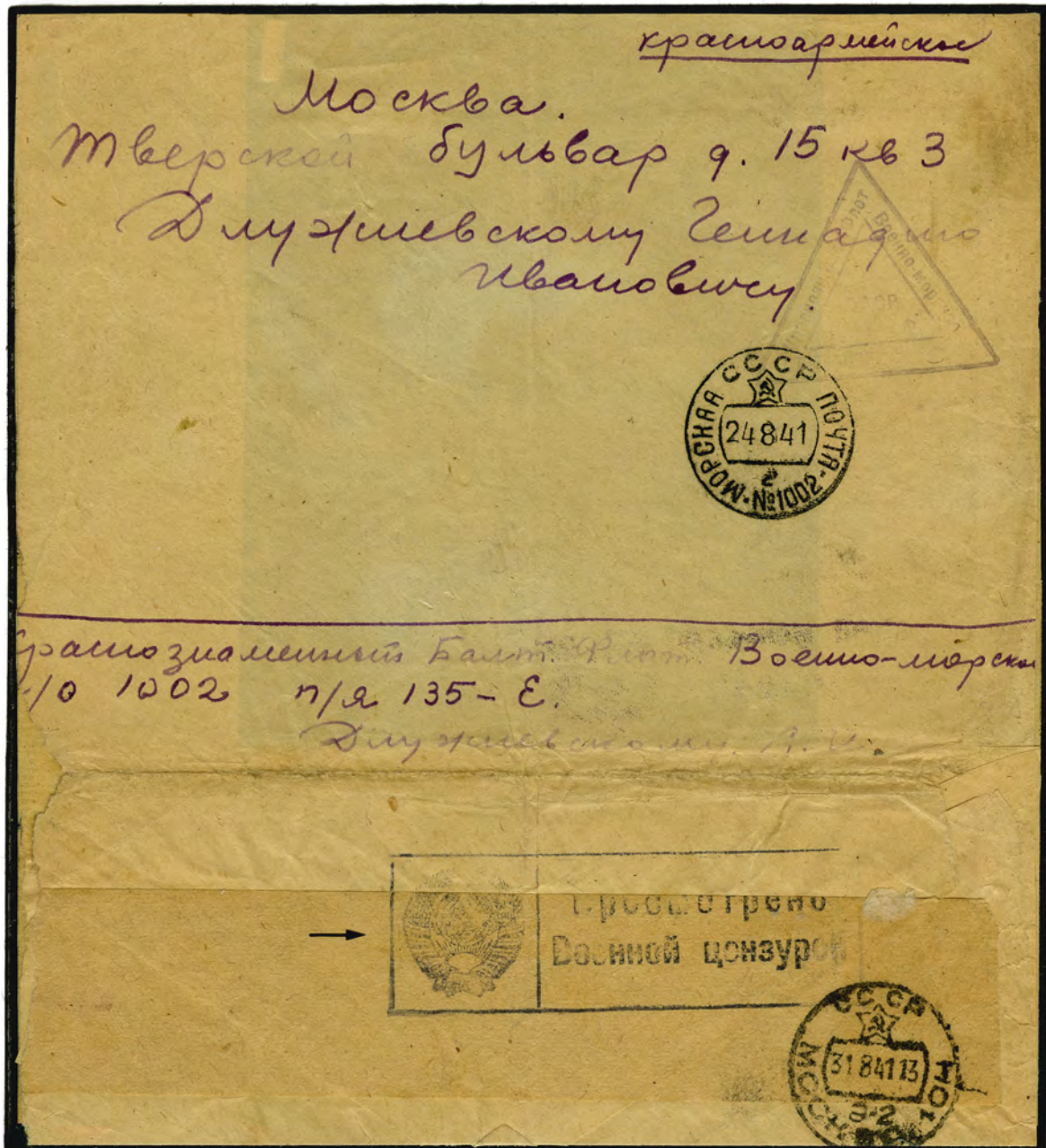
Красноармейское письмо, отправленное из "/, № 1002 (Таллинн) 24.08.1941 в г. Москву. Получено 31.08.1941.

КРОНШТАДТ. БАЛТИЙСКИЙ ФЛОТ. (Август – Ноябрь 1941 г.)