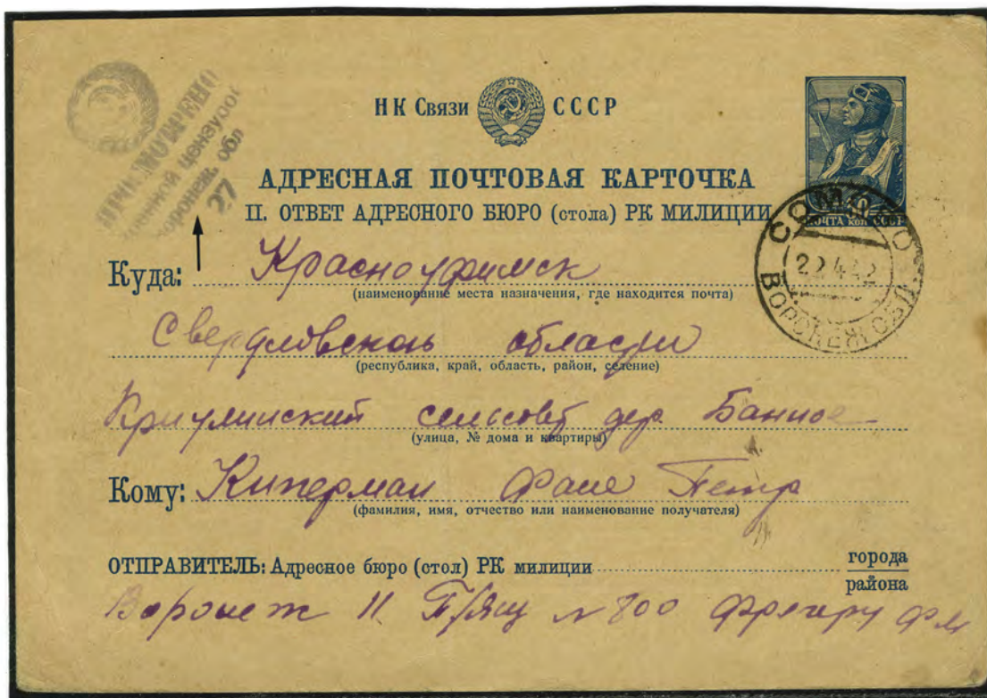
Адресная почтовая карточка, отправленная из г. Воронежа 22.04.1942 (использована как почтовая карточка) в г. Красноуфимск, Свердловской обл. (Просмотрено военной цензурой Воронеж обл. №27)