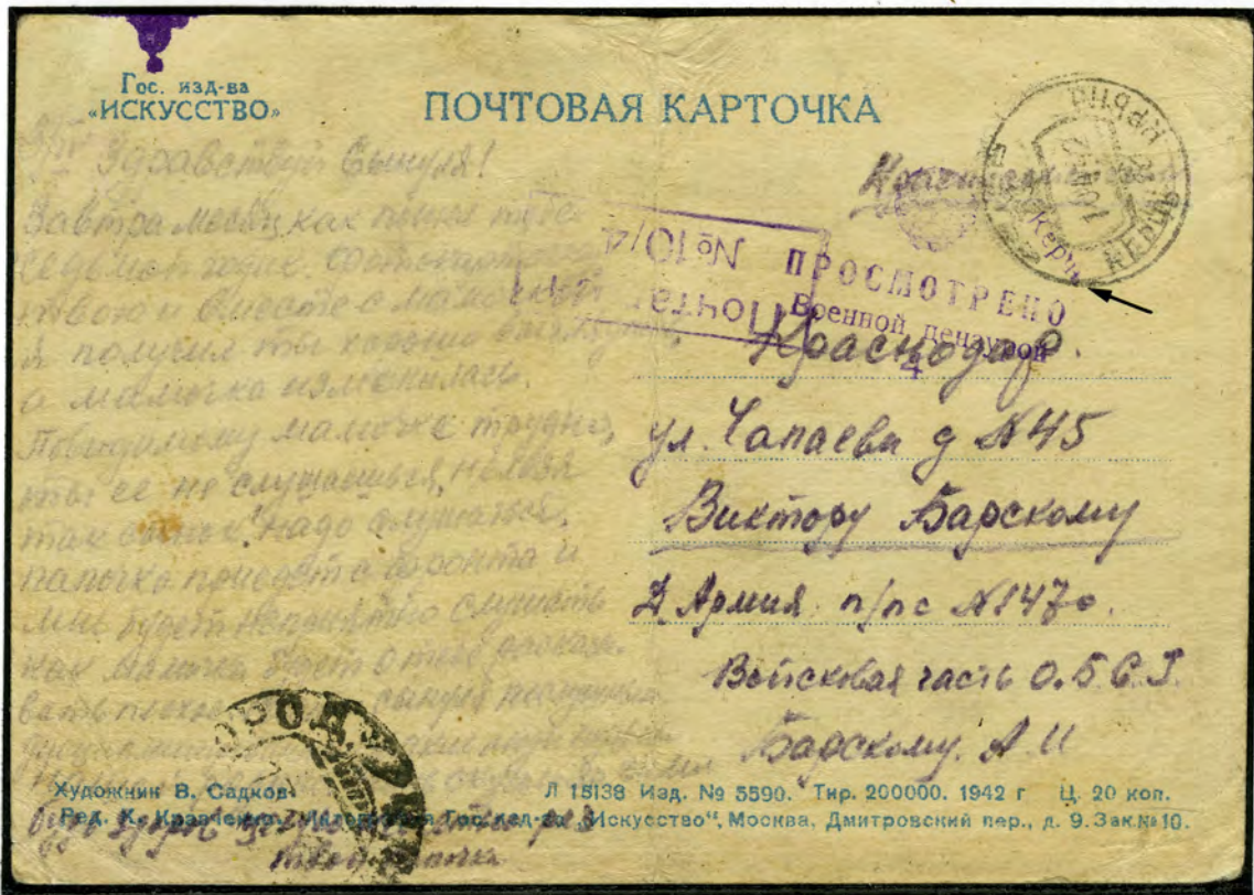
Почтовая карточка, отправленная из №1, 1470 10.04.1942 в г. Краснодар (Штамп почтальона №10/4) (Просмотрено военной цензурой Керчь №4)