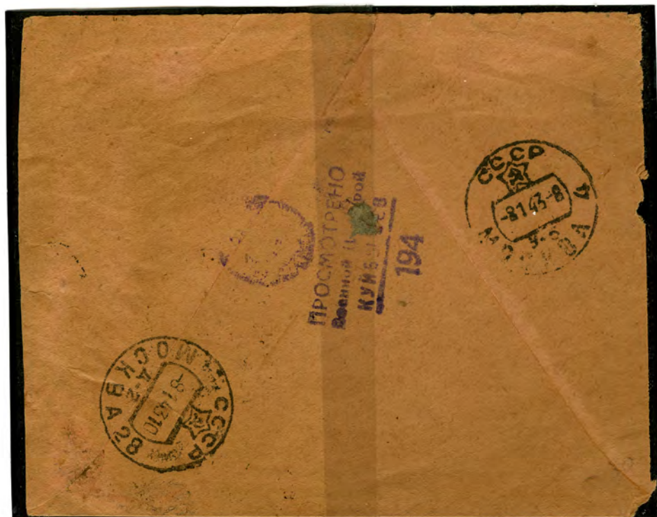
Иногороднее письмо, отправленное из г. Куйбышева 30.12.1942 в Москву. Получено 08.01.1943. ( Просмотрено военной цензурой Куйбышев № 194 )