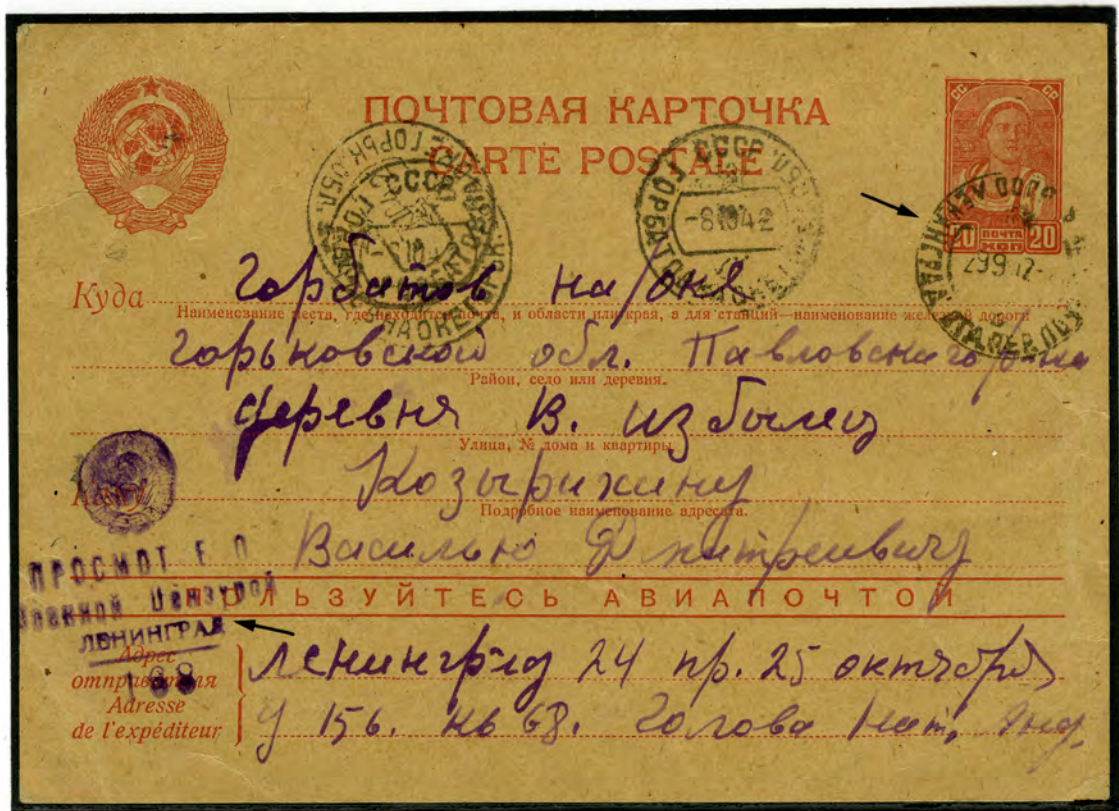
Иногородняя почтовая карточка, отправленная из Ленинграда 29.09.1942 в г. Горбатов-на-Оке. Получена 08.10.1942. (Просмотрено военной цензурой Ленинград № 168)