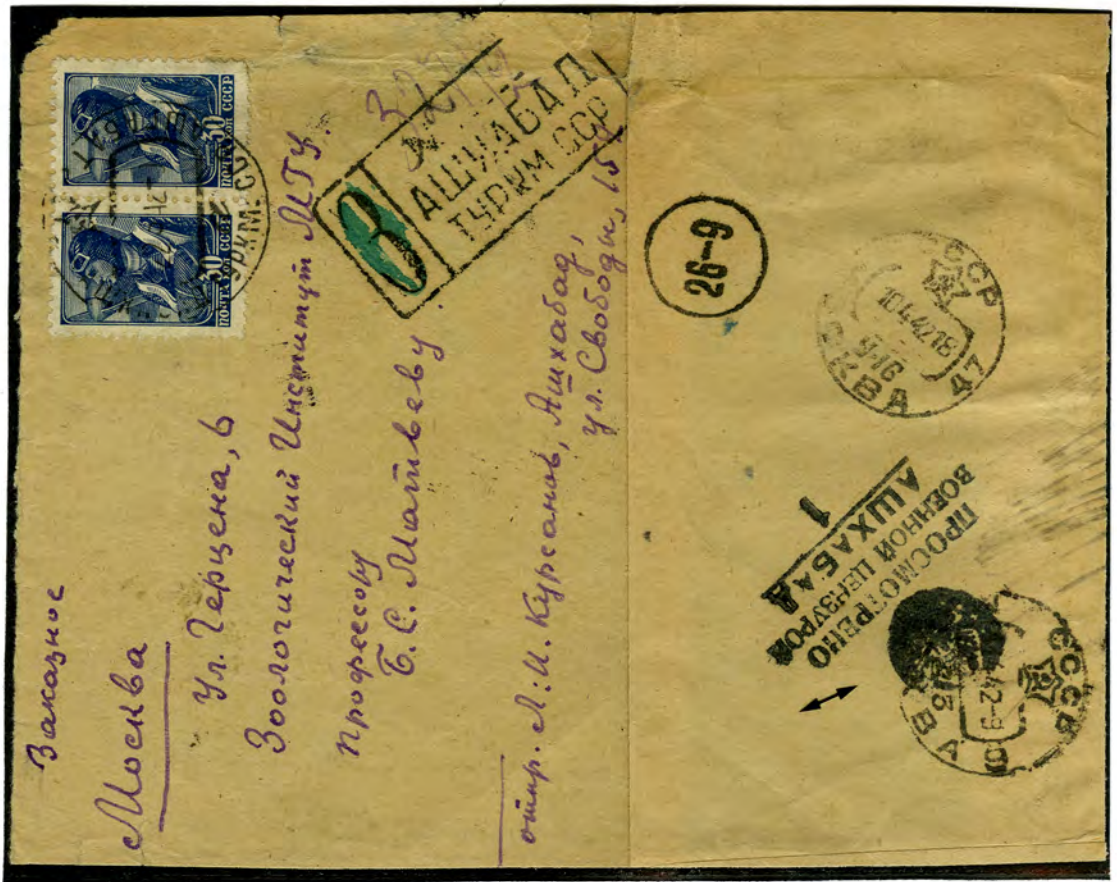
Иногороднее заказное письмо, отправленное из г. Ашхабада 22.03.1942 в Москву. Получено 10.04.1942. (Просмотрено военной цензурой Ашхабад № 1).