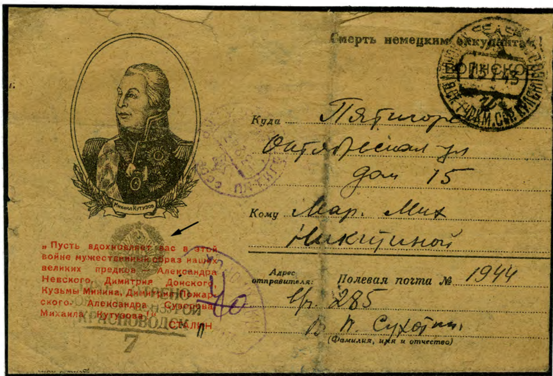
Секретка, отправленная из "1", 1944 г. Красноводск, Туркменской ССР 13.01.1943 в г. Пятигорск. Получена 03.02.1943. (Просмотрено военной цензурой Красноводск №7).