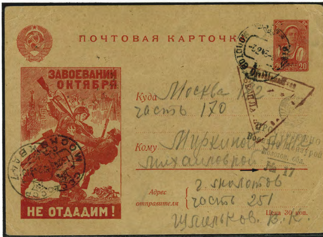
Иногородняя почтовая карточка, отправленная из г. Молотова 03.02.1943 (№/ч 251) в Москву. Получена 12.02.1943. (Просмотрено военной цензурой Молотов обл. №17)

3.6. ГЕРБ СССР, ТЕКСТ «ПРОСМОТРЕНО ВОЕННОЙ ЦЕНЗУРОЙ» В ДВЕ СТРОКИ, НАЗВАНИЕ ГОРОДА № ЦЕНЗОРА (ИСПОЛЬЗОВАЛИСЬ В БОЛЬШЕНСТВЕ ОБЛАСТНЫХ И КРАЕВЫХ ГОРОДОВ, СТОЛИЦАХ СОЮЗНЫХ РЕСПУБЛИК)