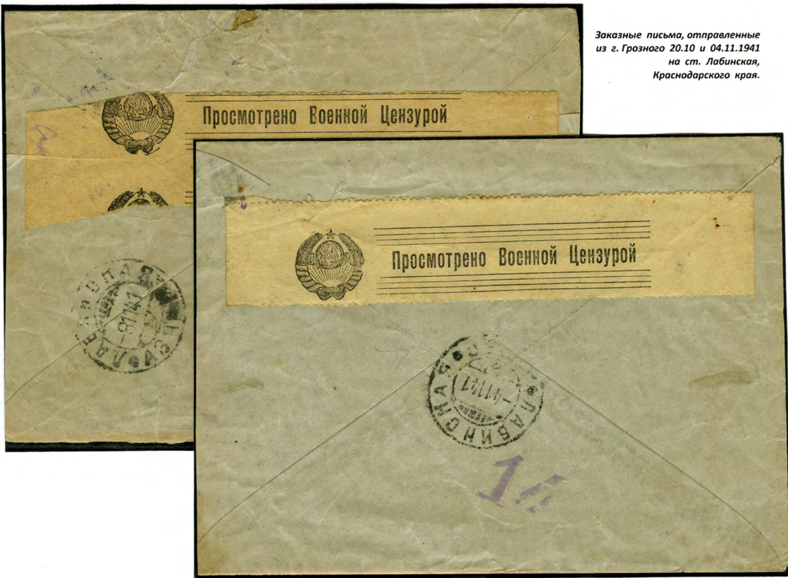
Заказные письма, отправленные из г. Грозного 20.10 и 04.11.1941 на ст. Лабинская, Краснодарского края.