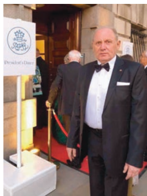
У входа в Зал приемов перед началом президентского обеда Королевского филателистического общества в Лондоне.

Осенью этого года в Лондоне произошло событие века. Даже, целых полутора веков! Дело в том, что после долгого-долгого нахождения на лондонском Девоншир плац, Королевское филателистическое общество переезжает по новому, более престижному адресу, и готово справиться свое новоселье уже на следующий, юбилейный год, открывающийся по традиции с началом очередного, 150-го сезона президентским обедом.. В соответствии с многочисленными и многолетними английскими традициями, то, что у нас